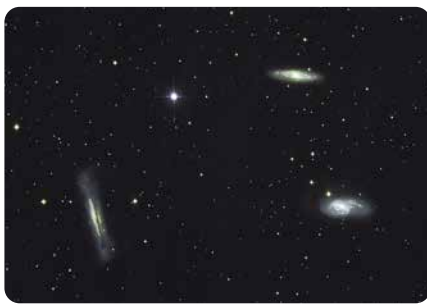
しし座のトリオ銀河 (大仙市協和)

天の川から外れたしし座、おとめ座の辺りにはたくさんの銀河があります。中でも、しし座の三つ子と呼ばれるM65(右上)、M66(右下)、NGC3628(左)は有名です。地球から光の速さで3500万年もかかる遠くの天体です。星空観望会などでぜひ3500万年前の光をご覧になってみてください。