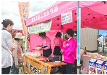
6月中旬から7月上旬に開催される「美郷町ラベンダーまつり」で、土・日曜に商工会女性部が美郷ため中を販売(昨年の出店の様子)