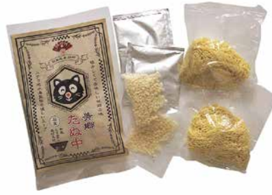
家庭でも気軽に美郷ため中を食べられるように、生麺、つゆ、揚げ玉がセットになったお土産用も販売されている