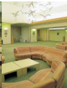
結婚式や披露宴も多く、ロビーは華やか