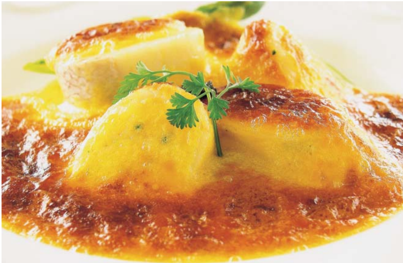
男鹿産地魚のポワレとズワイ蟹のソーセージ オランダーズソース