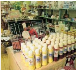
売店ではホテルのオリジナルドレッシングなども販売している