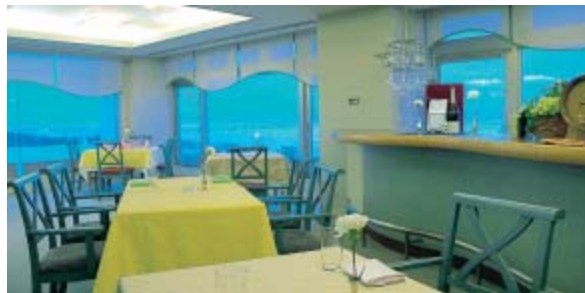
レストランからは男鹿半島や鳥海山も眺望できる