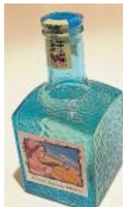
ホテルのオリジナル清酒「Rural Beauty」

その中間にあるこの宿はなかなか利用しやすい。秋田駅と八郎潟駅に送迎バスを出しているというのも、覚えておきたいポイント。遠方から秋田新幹線で秋田駅までやって来て、ホテルサンルール大潟に泊まり、翌日は人気の観光列車「リゾートしらかみ」に八郎潟駅から乗車して五能線の鉄道旅を楽しむといったプランも、交通アクセスの接続を気にせずにも実現できてしまう。 使い方のもう一つは、県内に住んでいる私たちが、たとえば結婚記念日や家族の誕生日などのちょっとしたお祝い、あるいは、何か美味しいものを食べてゆつくりとした休日をご過ごしたい、というようなさりげない理由で気軽に利用してみることだ。どちらの利用パターンでも、この宿が提供する”食”には、大いに注目し