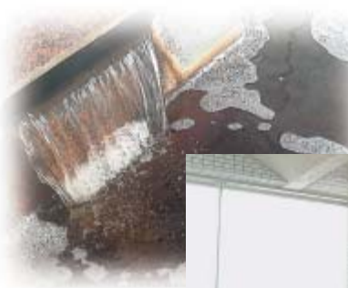
展望浴場。湯船に浮かぶ泡が温泉成分の濃さを物語る