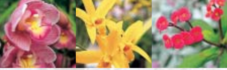
生態系公園鑑賞温室には色とりどりの花々が

かつて日本第二の広さを誇っていた湖・八郎潟を干拓して大潟村が生まれてから、今年十月で四十二年になる。一万五千ヘクタール余りという村の総面積は、全国的に見れば突出した広さではないが、それでも東京のJR山手線がすっぽりおさまる広大さだ。干拓でできた土地のため、視界をさえぎる地形の起伏がなく、大陸的な大地が果てしなく続く雄大な景観も魅力だ。