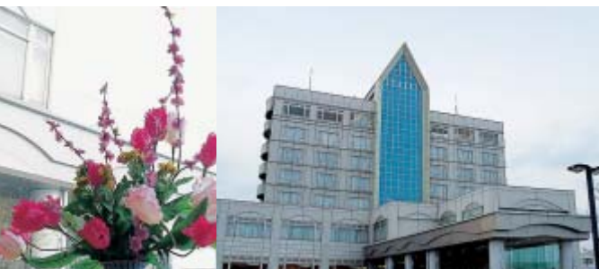
最上階がレストランと温泉浴場になっているホテル サンルーラル大潟