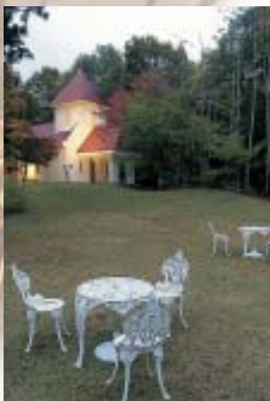
ガーデンパーティーも開ける 芝生の庭とチャペル

旅行会社のアンケートでも全国トップランクの評価を得るほど、クオリティーの高いサービスを提供し続けている。なぜそのような壮挙が果たせるのか。