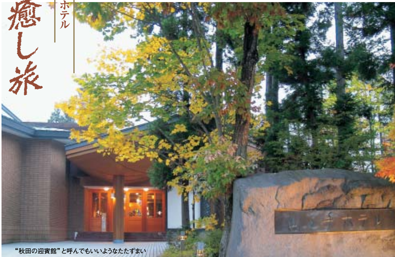
“秋田の迎賓館”と呼んでもいいようなたたずまい