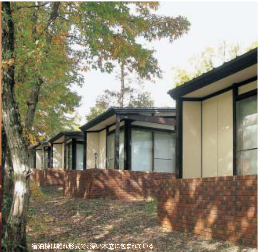
宿泊棟は離れ形式で、深い木立に包まれている