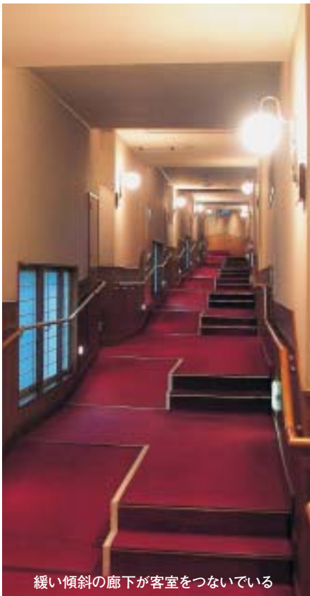
緩い傾斜の廊下が客室をつないでいる