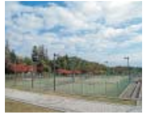
ホテルの目の前に大仙市営のテニスコートがある