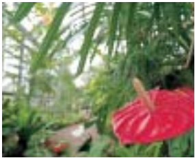
熱帯・亜熱帯の植物が約200種植栽されている農業科学館の温室