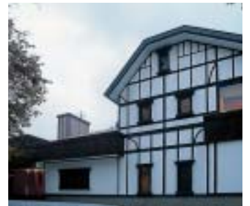
外国のリゾート地にありそうなホテルのイメージ