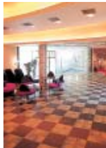
ウォーターロビーと名付けられたフロア