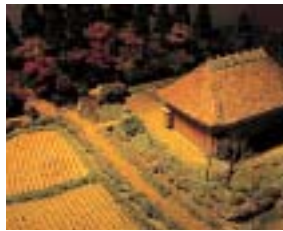
県立農業科学館では人形やジオラマで懐かしい農村風景を再現