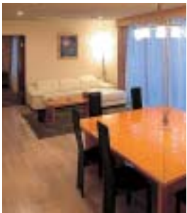
和洋特別室は1室のみのスペシャルスイート