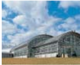
ホテルの近くに建つ県立農業科学館も斬新な建物だ