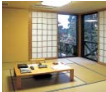
一般タイプの客室