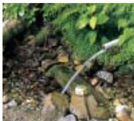
道の途中に湧水「長寿の水」