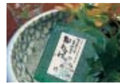
宿オリジナルラベルの日本酒

新生夏瀬温泉は、「都わすれ」という館名で平成17年8月にオープンした。広大な敷地に平屋離れ風の造りでわずか9室という部屋数、そして全室に野趣豊かな部屋専用露天風呂が付くというぜいたくさだ。湯は無色透明無臭のナトリウム・硫酸塩泉の源泉掛け流し。