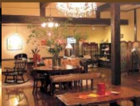
ロビーもゆったりとしたぜいたくな造り