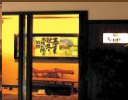
民芸調のエントランス