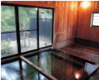
男女別の内風呂は時間で入れ替わる

館内にエステルーム(予約制)も新設して、とりわけ女性に喜ばれる宿づくりを目指している。それは、都会暮らしの経験のある女将ならではの、現代女性へのエールでもあるようだ。 開業後、風呂にだけでも入りたいという地元の人々の声意外に多いことを知り、急きょ無料休憩所を増築して、午前10時から午後3時までの間500円で日帰り客も受け入れている。 女王様気分が都わすれの一夜を過ごすのが一番だが、まずは下見を兼ねて日帰り入浴を試してみるのも一興。 (写真真ん中より右側二枚は秋田市)