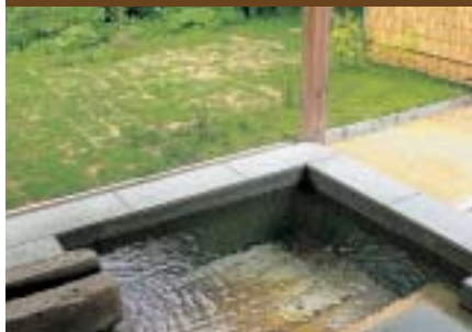
全客室に付いている専用露天風呂