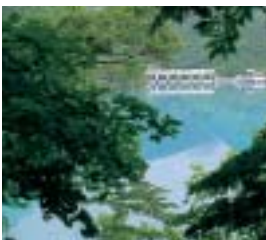
パステルブルーの神代ダム

先般、親日家で芭蕉の「奥の細道」への関心も強い李登輝前台湾総統が秋田を訪れたが、同氏が秋田で宿としたのが他ならぬこの「都わすれ」であった。周囲に他の人工物が見当たらないまったくの大自然の中の一軒宿、まさに自然に溶け込むかのような心持ちで過ごせる「都わすれ」でのひとときに、同氏も大満足の様子であったそうだ。