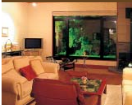
思い思いにくつろげる宿泊者専用クラブラウンジ