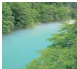
つり橋から眺める玉川の流れ