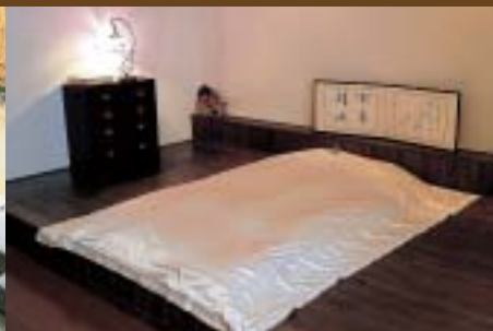
風雅な舞台風の寝室