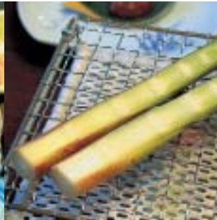
朝採り根曲がり竹の炙り焼き