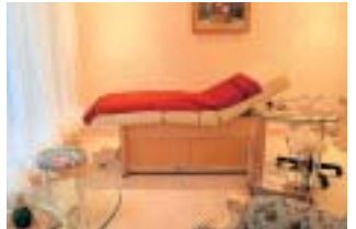
5月にオープンしたエステルーム

館内にエステルーム(予約制)も新設して、とりわけ女性に喜ばれる宿づくりを目指している。それは、都会暮らしの経験のある女将ならではの、現代女性へのエールでもあるようだ。 開業後、風呂にだけでも入りたいという地元の人々の声意外に多いことを知り、急きょ無料休憩所を増築して、午前10時から午後3時までの間500円で日帰り客も受け入れている。 女王様気分が都わすれの一夜を過ごすのが一番だが、まずは下見を兼ねて日帰り入浴を試してみるのも一興。 (写真真ん中より右側二枚は秋田市)