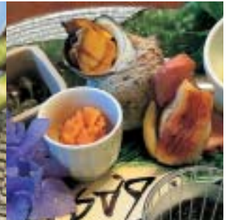
前菜もバラエティ豊か