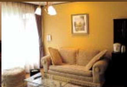
洋室タイプの客室はちょっとした邸宅風