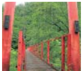
玉川の溪谷に架かる「夏瀬橋」