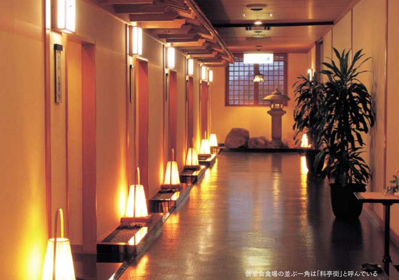
個室会食場の並ぶ一角は「料亭街」と呼んでいる