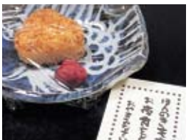
食事を終えて部屋に戻るとうれしい気遣いが

予約の際に相談するとよい。さとみは、東日本大震災発生直後から約8カ月に渡って、岩手宮城福島からの避難者延べ200名あまりを受け入れてきた。当時の避難者たちは今でもさとみに集ってお世話になった宿の人たちとの交流が続いている。そんな、人の情の通い合う宿でもあるのだ。