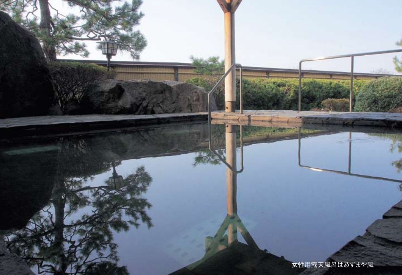
女性用露天風呂はあずまや風