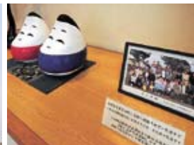
秋田温泉さとみでは震災避難者を受け入れた縁で今でも交流が続いている

市近郊在住であれば、仕事が終わってからチェックインし、一泊して翌朝そのまま勤めに出るといったことも不可能ではないだろう。一人旅も受け入れている。