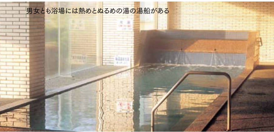
男女とも浴場には熱めとぬるめの湯の湯船がある