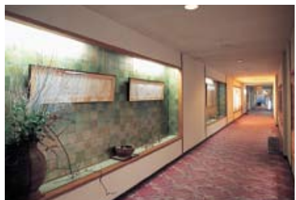
大浴場に続く廊下