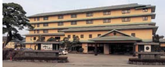
外観に和風の意匠を持つ5階建ての建物