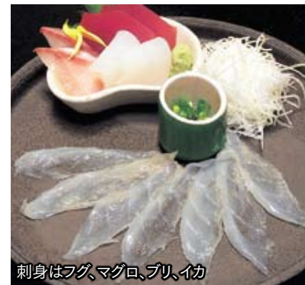
刺身はフグ、マグロ、ブリ、イカ