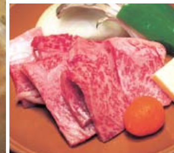
県内産牛の陶板焼き