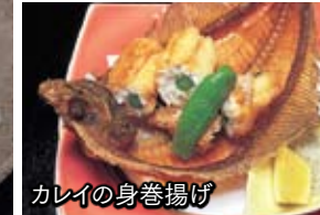
カレイの身巻揚げ

既製品は使わず、料理長が目にも舌にもおいしい料理に仕上げている。おいしいものを食べたい時に掛かけていきたい温泉宿なのだ。ちなみに、朝食はバイキングだが、ここにも秋田の郷土食を中心とした手の込んだ料理が多く並び、目移りするほど。料理に力を入れている宿であることがよく分かる。宿泊プランも多彩なので、予算や食の好みで選ぶといいだろう。