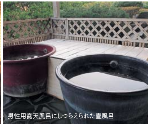
男性用露天風呂にしつらえられた壺風呂