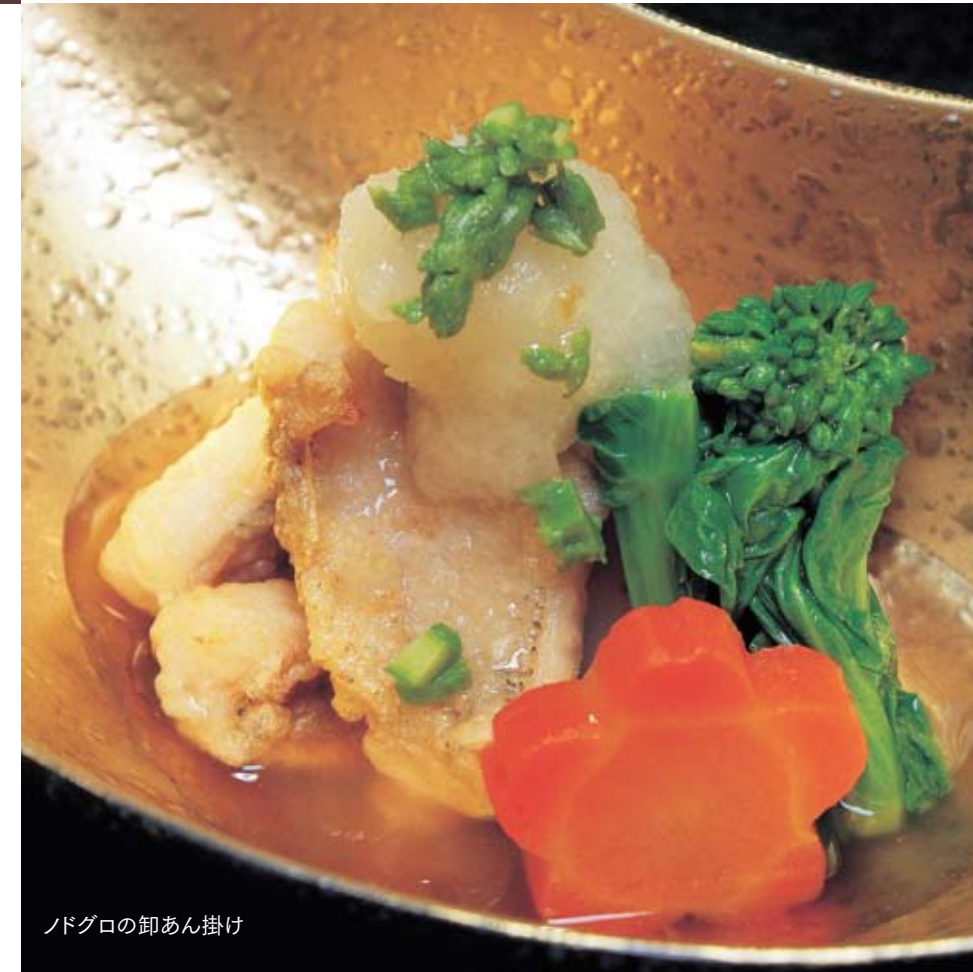
ノドグロの卸あん掛け